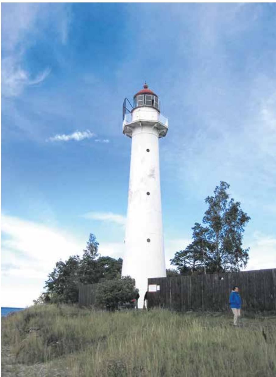
Milsvida omkring. Fyren på Ormsö.

Staden Hapsal (Haapsalu) som ligger cirka hundra kilometer väster om Tallinn har en befolkning på 10 000 invånare. Här fick vi bekanta oss med järnvägsstationen, som i början av 1900-talet byggdes för tsarens besök i staden. I dag har staden ingen järnvägsförbindelse. Numera är stationen en mötesplats och turistfälla som ofta används vid fotograferingar och