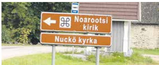
Nuckö föregår med gott exempel: tvåspråkigt på estniska och svenska.