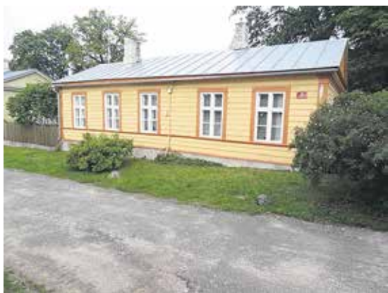
Kända vyer. Ilon Wikland bodde i gula huset som skolflicka. Miljön återfinns i Astrid Lindgrens böcker.

I slutet av 1980-talet upplevde Nuckö också en storhetstid. Gränzonen avvecklades, kustborna kunde återvända hem och man började undervisa i svenska igen. I dag har Nuckö drygt 800 invånare. ●