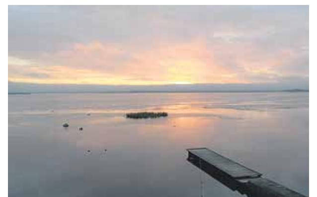
Solnedgång. Utsikt från Strandpromenaden i Hapsal.