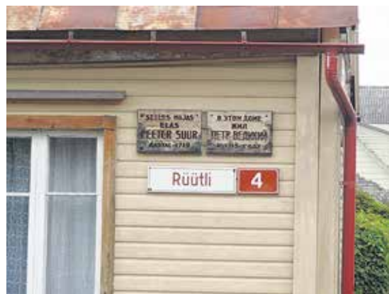
År 1715. Peter den store övernattade i det här huset när han var ute för att spana efter en lämplig plats för en örlogshamn.