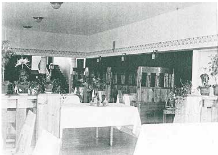
Matsalen på 1910-talet med trappuppgången i bakgrunden. Trappan, trapppräcken och väggdetaljer finns kvar men interiören i den gamla byggnaden ser helt annorlunda ut i dag. Matsalen har tidvis använts som vilorum för krigsinvalider som kommit till Kauniala för en kort rehabilitering och där kunnat sträcka ut sig på de många bäddarna.