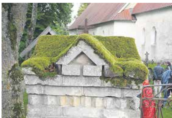
Grönska. Mossbelupen mur vid Nuckö kyrka.