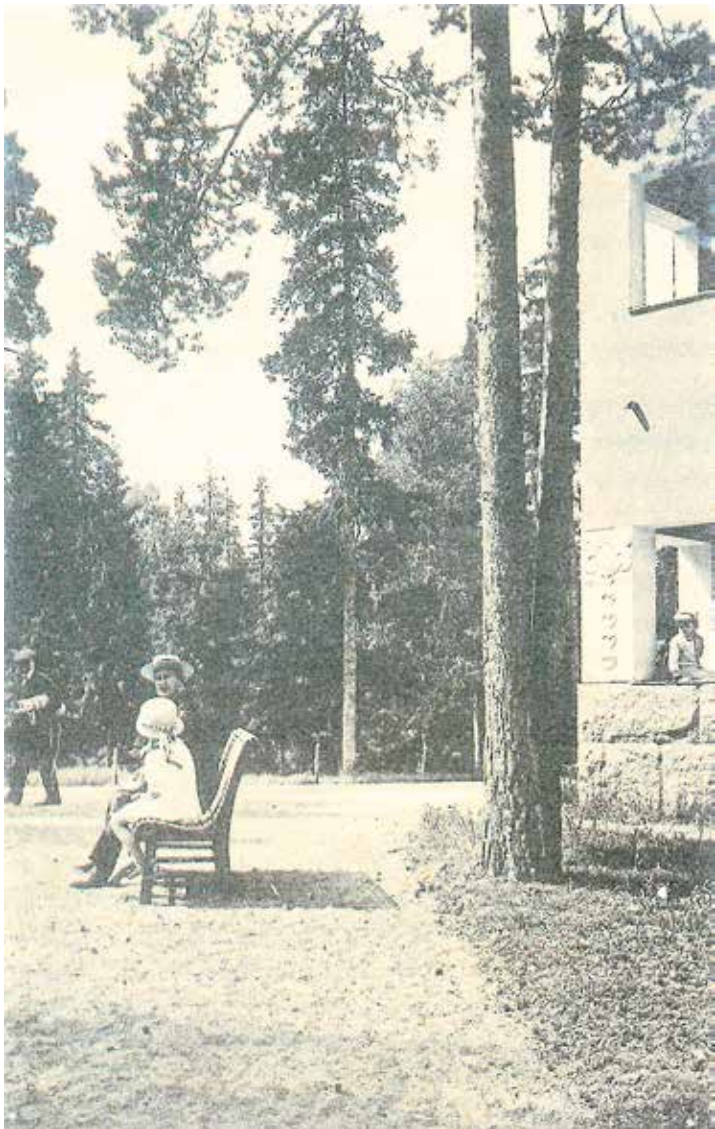
Far och dotter, kanske från St Petersburg på 1910-talet vid hörnet av Badets stora byggnad mot öster. Där låg läkarvillan. Den står kvar på granntomten och är i mycket gott skick.