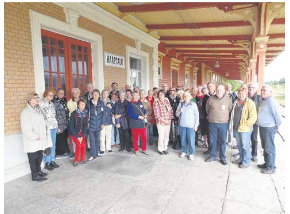
Byggdes för tsaren. Resenärer från Grankulla på järnvägsstationen i Hapsal.