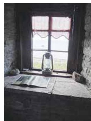
Tittut. Vacker vy från fyrtornets fönster på Ormsö.