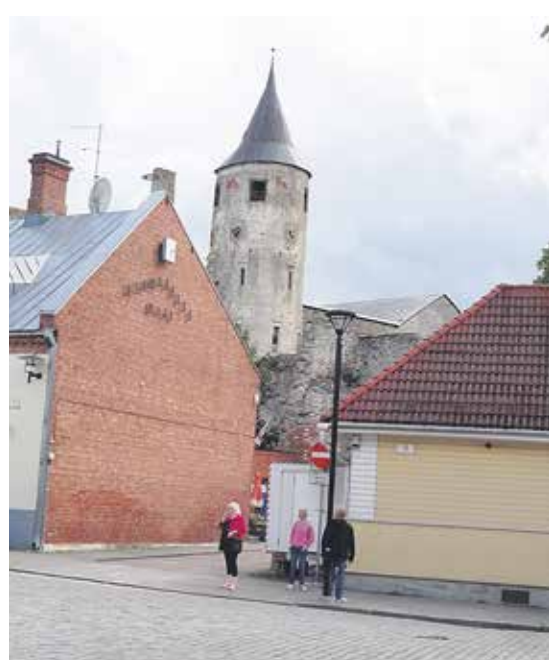
Stadens vardagsrum. Den gamla biskopsborgen i Hapsal.