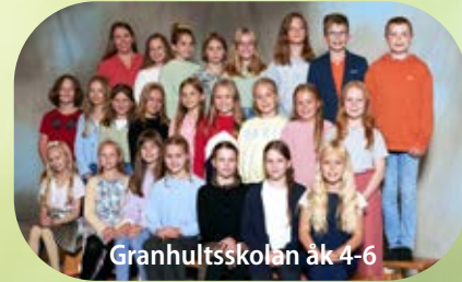
Granhultsskolan åk 4-6