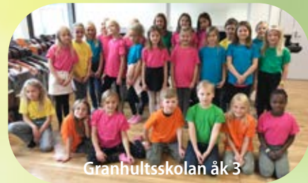
Granhultsskolan åk 3