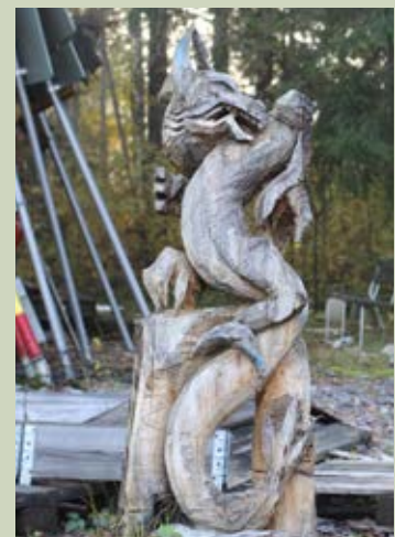
Vattendraken som finns på depåområdet i Bränntorp (norr om Domsby).