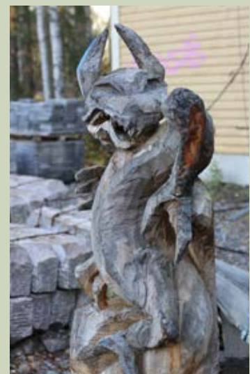
Samma drake från en annan vinkel.