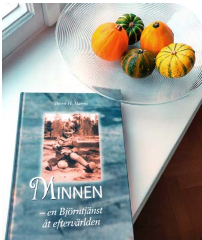
"Minnen - en Björntjänst åt eftervärlden" finns att låna på Grankulla bibliotek.