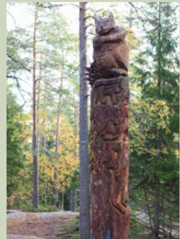
Totempålen vid konditionsslingan i Kasaberget med en ekorre i toppen.